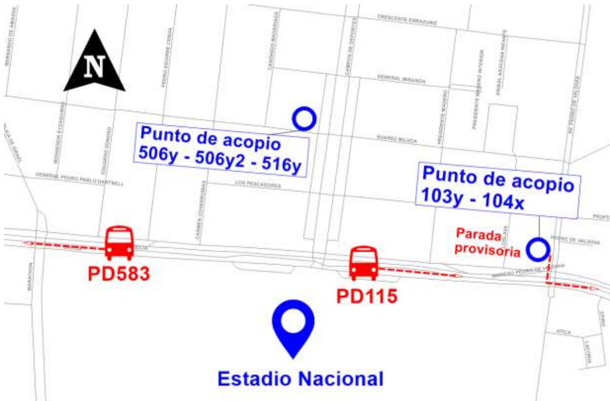
Ilustración 2: Puntos de acopio Estadio Nacional

El punto de parada de los servicios 103y y 104x también se utilizaría como punto de acopio.